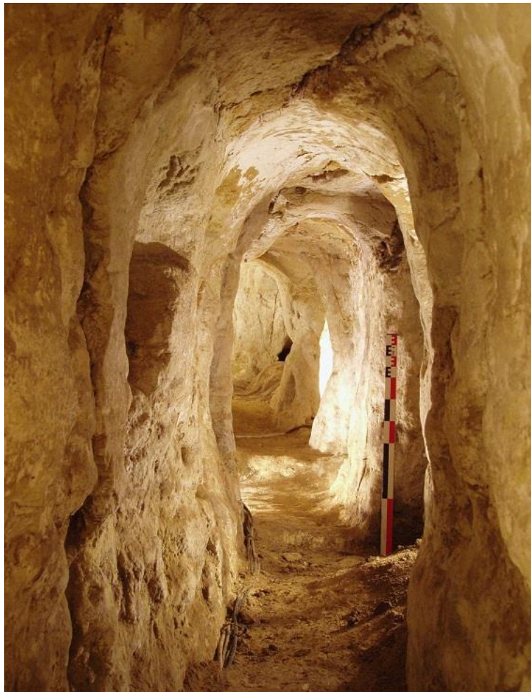
Galerie de communication